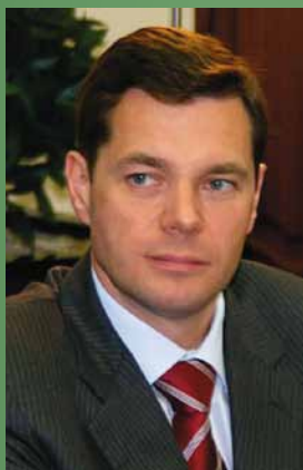
МОРДАШОВ АЛЕКСЕЙ АЛЕКСАНДРОВИЧ Генеральный директор

ОАО «Северсталь» – международная вертикально-интегрированная горно-металлургическая компания, акции которой представлены в Российской торговой системе (РТС) и на Лондонской фондовой бирже (LSE). Компания концентрирует свое производство на продуктах высокой добавленной стоимости и уникальных нишевых продуктах. Активы компании находятся в России, Украине, Казахстане, Италии, Франции, Соединенных Штатах и в Африке. В 2010 году Северсталь произвела 14.7 млн. тонн стали и зафиксировала выручку в размере 13.57 млрд. долл. США. EBITDA компании в 2010 году составила 3.3 млрд. долл. США.